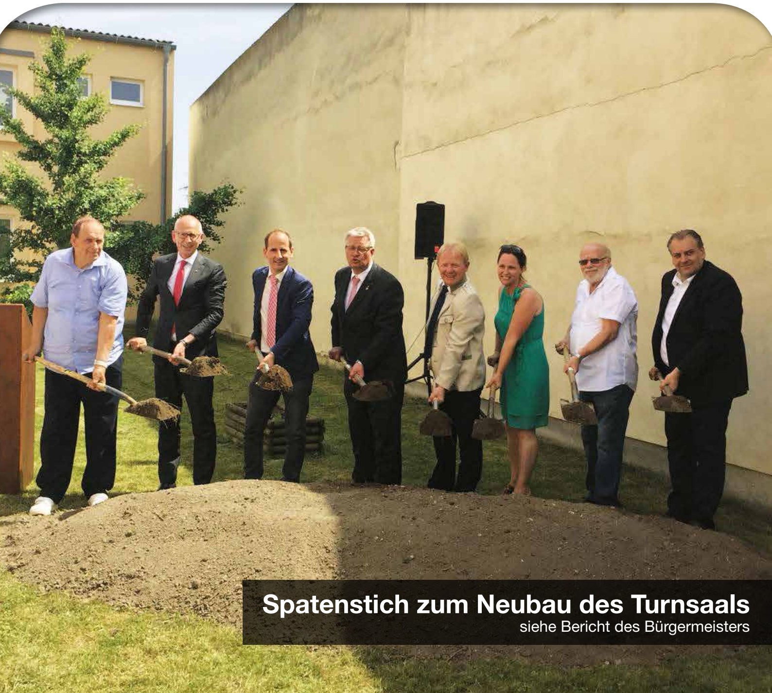
Spatenstich zum Neubau des Turnsaals siehe Bericht des Bürgermeisters

Medizinische Versorgung für Mitterndorf gefordert. . . . . Seite 2