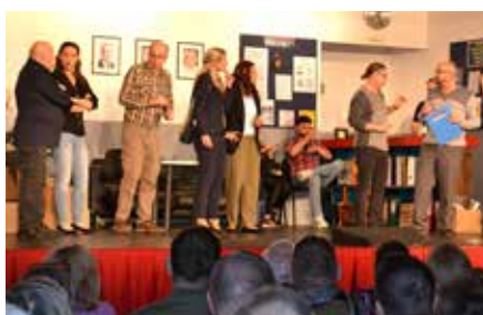
Lustig: Brettblödler spielten auf