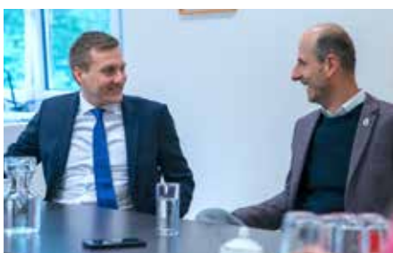
Besuch: Termin mit Landesrat

Zentrumsentwicklung mit Wohnraum und Einkaufsmöglichkeiten